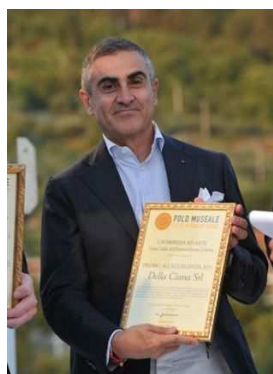
Della Ciana S.r.l.