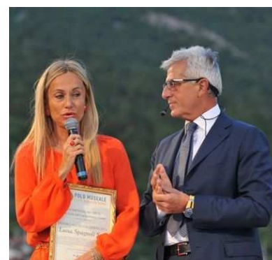
Luisa Spagnoli S.p.a.